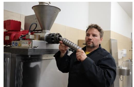
gepresst und abgefüllt im